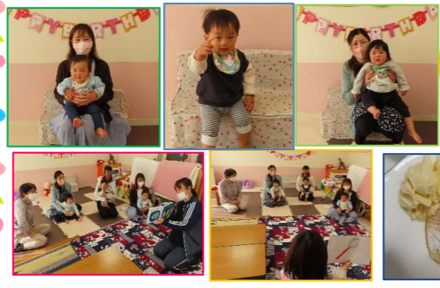
スフレパンケーキにアイスを添えて♡